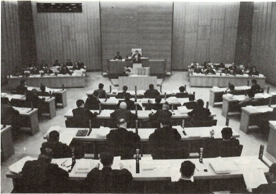
会期20日間で開かれた、12月定例市議会本会議