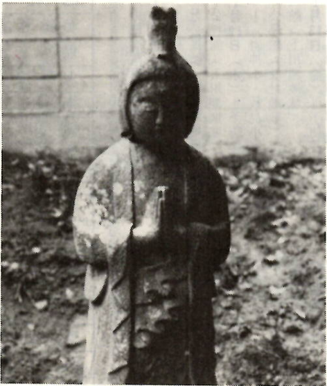
青柳町龍蔵寺大師堂うらにある丸彫馬頭観音

前橋の野仏たち 頭上にある馬のことを、「宝馬」と呼んでいます。この宝馬が四方を駆けめぐって、猛突進し生死の大海を飛び渡り、四魔を承伏する猛威力を表わし、そして無明のあらゆる障害を食い尽くされています。また馬頭観音は両手で異形の合掌をしているのです。その合掌は馬の口形をしているのです。これを「馬口印」と呼んでいます。