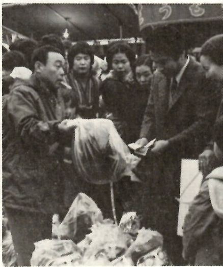
にぎわう「だるま市」(昨年)

高年齢者技能コーナー 職業相談 一月十日、十七日、二十四日、三十一日の各火曜日、午前九時から午後三時まで。相談場所は、東京電力前橋サービスセンター(千代田町四丁目一一二二、電話31