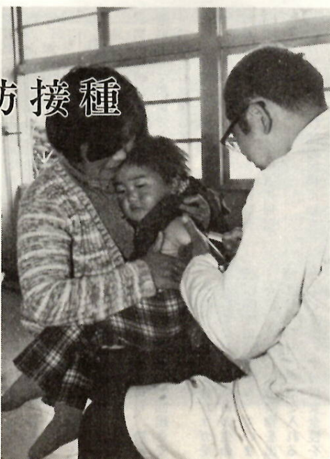
三種混合予防接種

市では、三種混合予防接種（百日せき、ジフテリア、破傷風、混合ワクチン）を、昨年十一月から実施しています。この予防接種は、第一期を三週間から八週間の間隔で三回、第二期を第一期完了後一年以上たっている人で、満五歳半までの子ども。