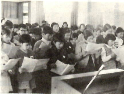
合唱練習をする児童 文化センター合唱団