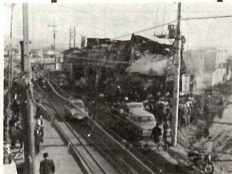
1月12日、古市町で親子4人が焼死した火災現場

死因は―― 一酸化炭素中毒 と窒息が一位 ○：さて、焼死事故は、次のようなときは、多くでています。 △夜間▽逃げ遅れ(百九十二