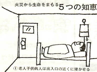
火災から生命をまもる5つの知恵

○：死者のなかでは、老人、子ども、病人が多く、時間的には深夜、二階のある建物では二階に就寝中が圧倒的に多くなっています